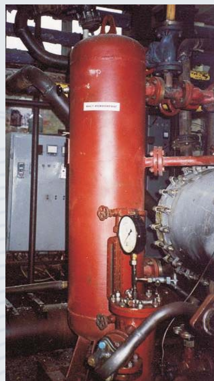
Сепаратор новой конструкции компрессора холодильной машины

В качестве увлажнителей и осушителей воздуха для топливных элементов и т.д.